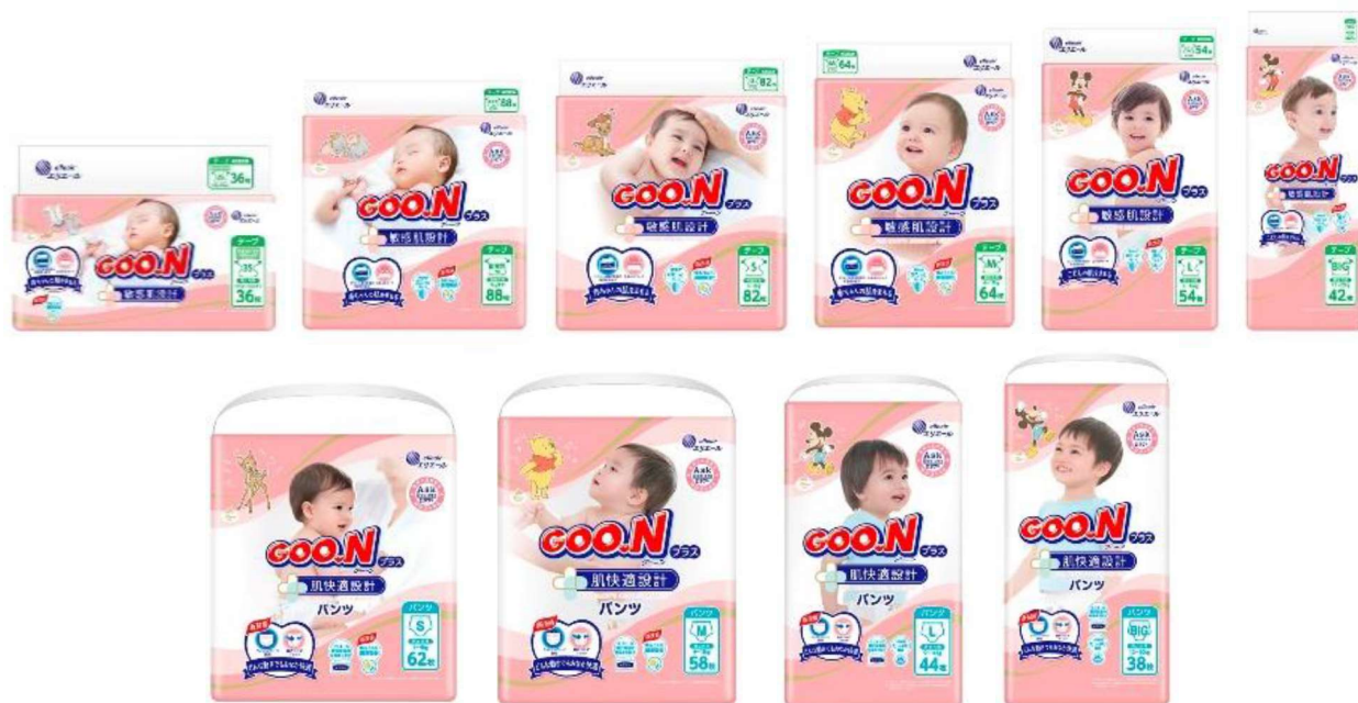
テープタイプ『グーンプラス 敏感肌設計』6種 + パンツタイプ『グーンプラス 肌快適設計』4種

衛生用紙製品 No.1 ブランド ※2 の「エリエール」を展開する大王製紙株式会社（本社：東京都千代田区）は、赤ちゃんの敏感肌を考え、肌への刺激を減らすことに着目したベビー用紙おむつ『グーンプラス』シリーズ（全 10 アイテム）の品質を改良し、商品パッケージをディズニーデザインに刷新して 2021 年 12 月 1 日（水）より全国で発売します。