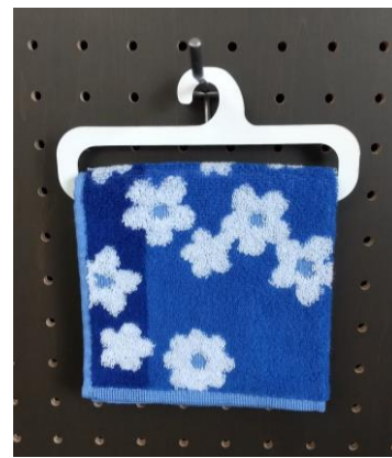
エリプラミニハンガー

各企業や個人の皆さまが様々な形で地球環境の改善に関心を持ち、環境にやさしい素材・商品を求められる機会が増えています。当社グループでは、それらのご要望にお応えするため、プラスチック代替素材として高密度厚紙「エリプラペーパー」（2019年5月）、また耐水性・耐油性を付与した「エリプラ+ (プラス)」（2020年6月）の販売を開始し、これまでにピックやナイフ、ハンガーなどで採用されて来ました。