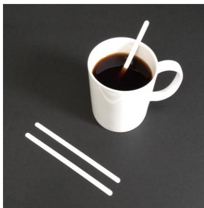
エリプラマドラー