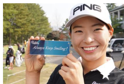
選手の方々にも「Always Keep Smiling!」で 大会を盛り上げていただきました