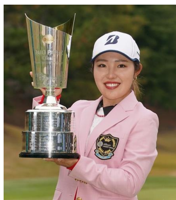
今大会優勝した古江 彩佳選手

当社は、今後も経営理念である「世界中の人々へ やさしい未来をつむぐ」を実現するために、大会を通じてチャリティ活動によるこども、女性支援や環境に配慮した運営に取り組み、地域社会との調和ある成長を目指して参ります。