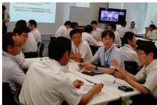
メンタルヘルス研修