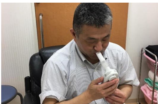
禁煙外来を利用した役員禁煙チャレンジ

所定労働時間内禁煙を就業規則に規定、禁煙外来の費用助成、役員禁煙チャレンジ、社員やその家族による禁煙ポスターの制作・表彰 等