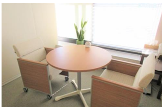
社外相談窓口（カウンセリングルーム）