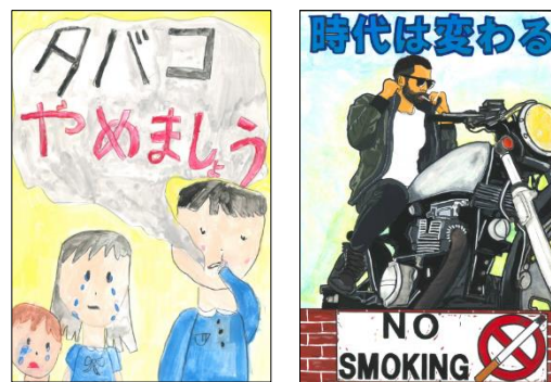
社内禁煙ポスター

今後もより一層、「役員・社員並びにその家族の健康が企業の財産」という考えに基づき、健診結果の数値分析・評価に裏づけされた具体的な健康増進施策を推進すると共に、社員一人ひとりが安心して生き生きと働ける職場環境づくりを目指して参ります。