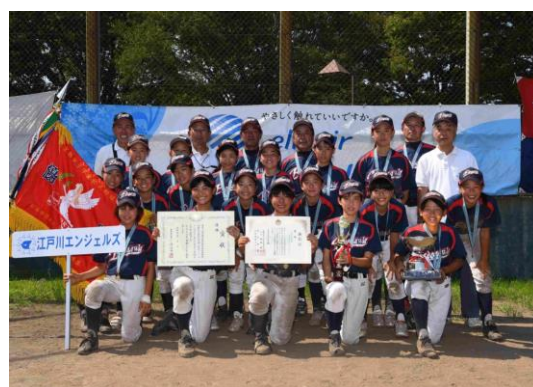
女子学童軟式野球大会 昨年優勝の「江戸川エンジェルス」