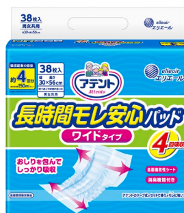
アテント 長時間モレ安心パッドワイドタイプ 4回吸収 38枚

大王製紙株式会社（住所：東京都千代田区）は、従来の「アテント 長時間 1枚安心パッドおしりを包む大判サイズ 4回吸収」を、テープ式に併用するパッドを初めて使う生活者に向けて、「アテント 長時間モレ安心パッドワイドタイプ 4回吸収」としてリニューアルし2019年4月21日（日）より全国で発売します。