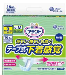
アテント 背モレ・横モレも防ぐ うす型下着感覚テープ式