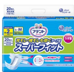
アテント 背モレ・横モレも防ぐ うす型スーパーフィットテープ式 S-M20枚