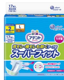
アテント 背モレ・横モレも防ぐ うす型スーパーフィットテープ式 L17枚