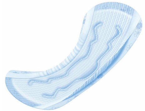
※ナチュラさら肌さらり 吸水ナプキン 長時間快適用 イメージ図

■商品名:『ナチュラ さら肌さらり』、『ナチュラ さら肌さらりコットン 100%』