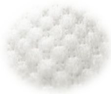
お肌ふわさらシート