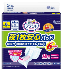
アテント 夜1枚安心パッド

大王製紙株式会社(住所：東京都千代田区)は、「アテント 夜1枚安心パッド 仰向け・横向き寝でもモレを防ぐ6回吸収」を肌へのやさしさそのままに、よりモレにくい品質へリニューアルし、2019年3月21日(木)より全国で発売します。