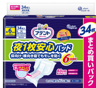
アテント 夜1枚安心パッド