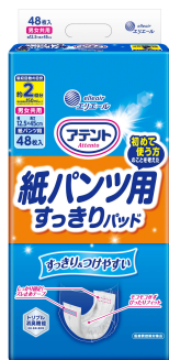
『アテント 紙パンツ用すっきりパッド 2回吸収』

衛生用紙製品 No.1 ブランド ※1 の「エリエール」を展開する大王製紙株式会社（本社：東京都千代田区）は、「アテント 紙パンツ用さらさらパッド 通気性プラス」のモレやつけやすさを改良した『アテント 紙パンツ用すっきりパッド 2回吸収』、『アテント 紙パンツ用夜 1枚安心パッド 4回吸収／6回吸収』を2024年5月21日（火）から全国発売します。