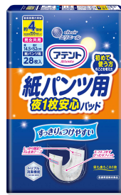
『アテント 紙パンツ用夜 1枚安心パッド 4回吸収／6回吸収』