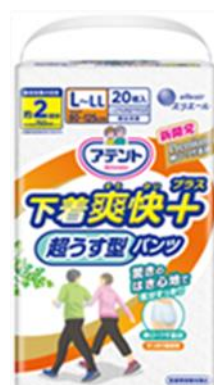
アテント 超うす型パンツ 下着爽快プラス L～LL 男女共用 20枚