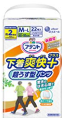
アテント 超うす型パンツ 下着爽快プラス M～L 男女共用 22枚

大王製紙株式会社（住所：東京都千代田区）は、はいていることを忘れるぐらいの驚きのはき心地、「アテント超うす型パンツ下着爽快プラス」を2018年9月21日（金）より新発売します。