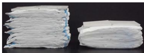
当社従来品 すっきりスリム2回吸収