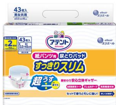
アテント 紙パンツ用尿とりパッドすっきりスリム 2回吸収 43枚

大王製紙株式会社（住所：東京都千代田区）は、紙パンツ用尿とりパッドにうすさを求める生活者に向けて、「アテント紙パンツ用尿とりパッド すっきりスリム 2回吸収」を2018年9月21日（金）より新発売します。