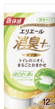
12 R (ダブル)

エリエール消臭+ (プラス) トイレットティッシュ ほのかに香るナチュラルクリアの香り