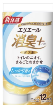
12 R (ダブル)

エリエール消臭+ (プラス) トイレットティッシュ しっかり香るフレッシュクリアの香り