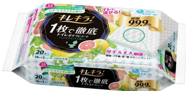
キレキラ！1枚で徹底トイレおそうじシート シトラスミント つめかえ用20枚(10枚×2P)