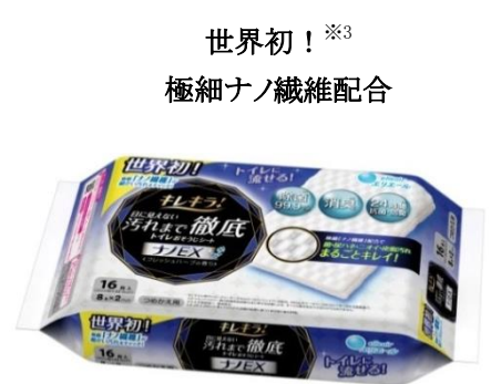
世界初！※3 極細ナノ繊維配合 キレイラ！目に見えない汚れまで徹底 トイレおそうじシート ナノEX つめかえ用16枚