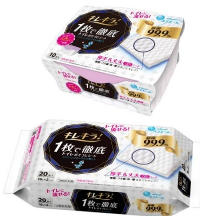
キレイラ！1枚で徹底トイレおそうじシート 本体10枚/つめかえ用20枚

※3 トイレ用ペーパークリーナーでセルロースナノファイバーを配合。Mintel社データベース2017年1月大王製紙調べ。