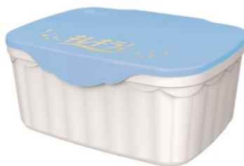
本体容器の蓋は 初夏の青空をイメージした さわやかなブルーです。