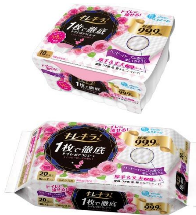
キレイラ！1枚で徹底トイレおそうじシート ハッピーローズ 本体10枚/つめかえ用20枚