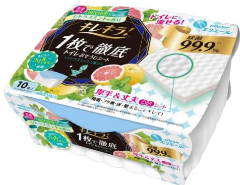
キレキラ！1枚で徹底トイレおそうじシート シトラスミント 本体10枚

6月21日(水)に発売する数量限定のフレグランス「キレキラ！シトラスミント」は、夏のそよ風の中、シトラスフルーツが爽りハーブが香るお庭をイメージしたさわやかな香りです。本体容器も初夏の青空をイメージした限定色です。ぜひお手にとってお試しください。